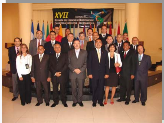
El Señor Ministro de Obras Públicas de Panamá, Dr. Benjamín Colamarco Patiño, inauguró la XVII Reunión de Directores de Carreteras

Los siguientes son Objetivos del Consejo de Directores de Carreteras de Iberia e Iberoamérica, sin que ellos tengan carácter taxativo y sin que otros puedan servir para alcanzar los propósitos que inspiraron su creación y en un mejoramiento de la gestión vial en los países miembros: