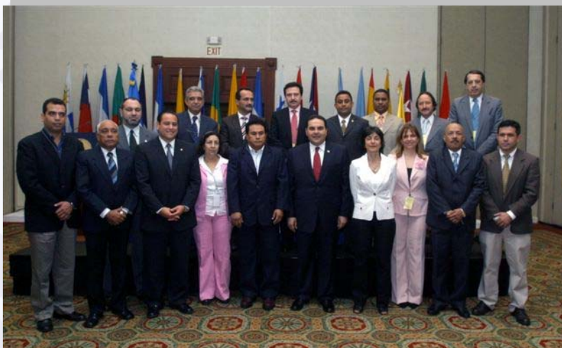
El señor Presidente de la República de El Salvador, Don Elías Antonio Saca, preside la inauguración de la XIV Reunión de Directores.

Las iniciativas y decisiones del Consejo de Directores de Carreteras se sustentan en el diálogo e intercambio de experiencias y, además, en los trabajos específicos desarrollados a instancias de los propios Directores, sobre temas tales como el mantenimiento, la organización administrativa, la gestión, construcción, la financiación y la integración de las redes de carreteras, entre otros de no menos importancia.