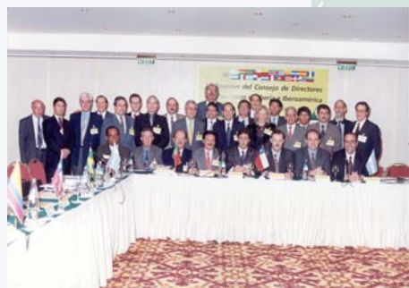
VI Reunión de Directores de Carreteras realizada en Buenos Aires (Argentina) contó con la presencia del Secretario de Obras Públicas de Argentina, el Ministro de Obras Públicas del Uruguay y el Subsecretario de Obras Públicas de Chile.