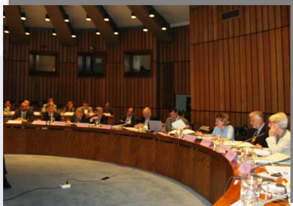
XI Reunión del Consejo en Sesión Plenaria con Reunión de la AIPCR en la ciudad de Santiago (Chile)

Las actividades del Consejo estarán dirigidas por un Presidente, secundado por dos Vicepresidentes, cuyos mandatos tienen una duración de tres (3) años. La elección del Presidente se efectúa por votación entre todos los miembros del Consejo cuyo país este representado en la Reunión en que se hace la elección.